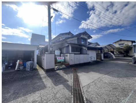
前面道路と敷地（平坦）