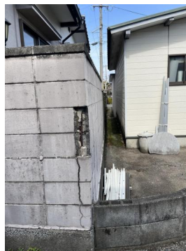
隣地境界1ブロック塀は売主が解体する予定です。