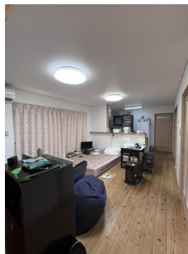
1階リビング約10畳（現況優先します。）

近隣との境界立会い済み。地積更生登記済みです。井戸は現在の所有者がお払い済みです。（埋めてはいません。）