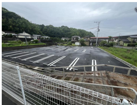
アスファルト舗装された駐車場