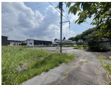
駐車場入口2（手前の畑の奥が駐車場になります。）