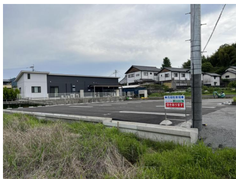
アスファルト舗装の駐車場になります。