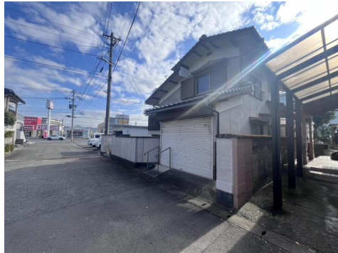
前面道路と敷地（平坦）