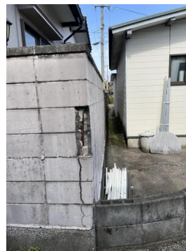
隣地境界1ブロック塀は売主が解体する予定です。