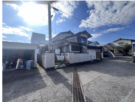
前面道路と敷地（平坦）