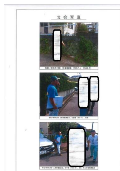
境界立会1（前面道路）